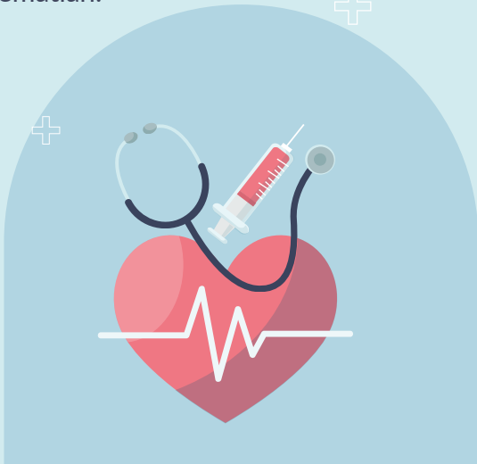
Promosi Kesehatan Rumah Sakit Ciremai Kemenkes RI

Apabila tidak ditangani dengan cepat, maka aliran darah terhambat dalam waktu lama sehingga otot jantung akan mengalami kerusakan yang bisa berujung pada kematian.